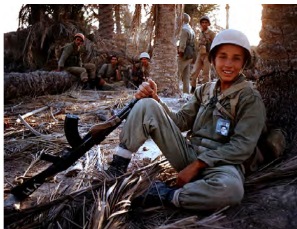
دانش‌آموز رزمنده در جبهه

معلمان و دانش‌آموزان نیز نقش چشمگیر و تأثیرگذاری در هشت سال دفاع مقدس داشتند. در واقع جبهه‌های جنگ شاهد حضور صدها هزار دانش‌آموز و معلم ایرانی بود که برای دفاع از سرزمین مادری و کیان نظام اسلامی به جبهه رفتند و در سنگرها نیز از درس و مشق غافل نماندند. در طول دفاع مقدس حدود ۲۵۰۰ معلم و قریب ۳۶۰۰۰ دانش‌آموز به شهادت رسیدند و هزاران نفر هم جانباز، اسیر و جاویدالایر شدند.