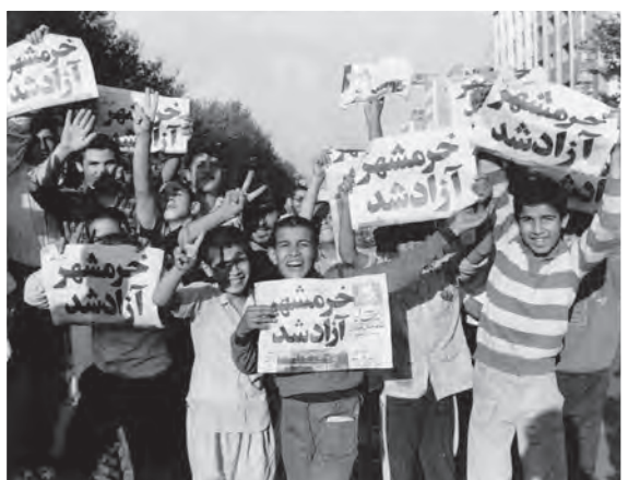
شادی خردسالان پس از آزادی خرمشهر