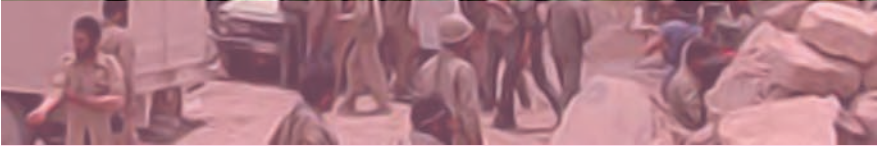
خرمشهر در زمان آزادی از اسارت

رهای خرمشهر علاوه بر تقویت وحدت ملی در داخل کشور، ابتکار عمل را در جنگ به ایران داد. پس از فتح خرمشهر، جنگ وارد مرحله تازه‌ای شد. از یک سو موفقیت‌های نظامی رزمندگان ایرانی ادامه یافت و از سوی دیگر حامیان خارجی صدام برای جلوگیری از سقوط او، انواع تجهیزات نظامی پیشرفته و اقسام سلاح‌های میکروبی و شیمیایی را در اختیار وی گذاشتند. هنگامی که نیروهای متجاوز در جبهه جنگ متحمل شکست‌های سنگینی شدند، بیش از گذشته مناطق مسکونی و مردم غیرنظامی را با هواپیما و موشک مورد هدف قرار دادند.