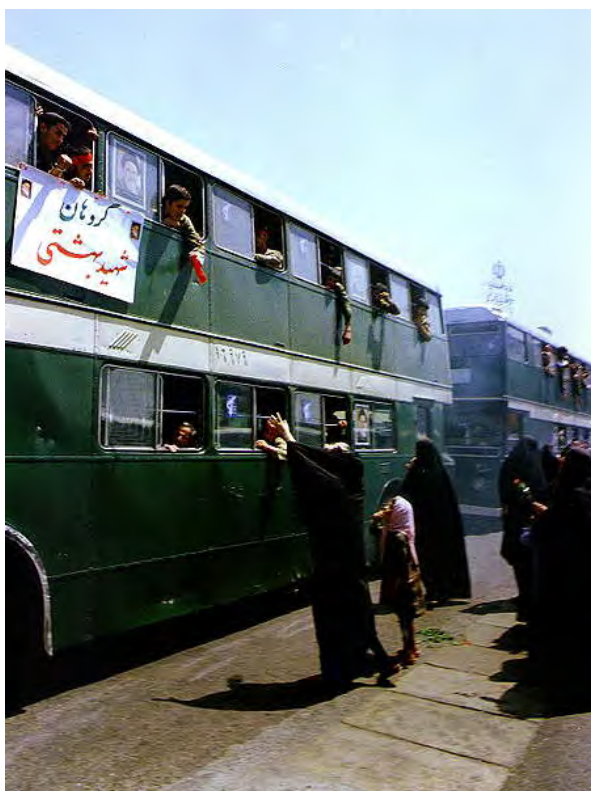
بدرقه رزمندگان توسط خانواده ها - تهران