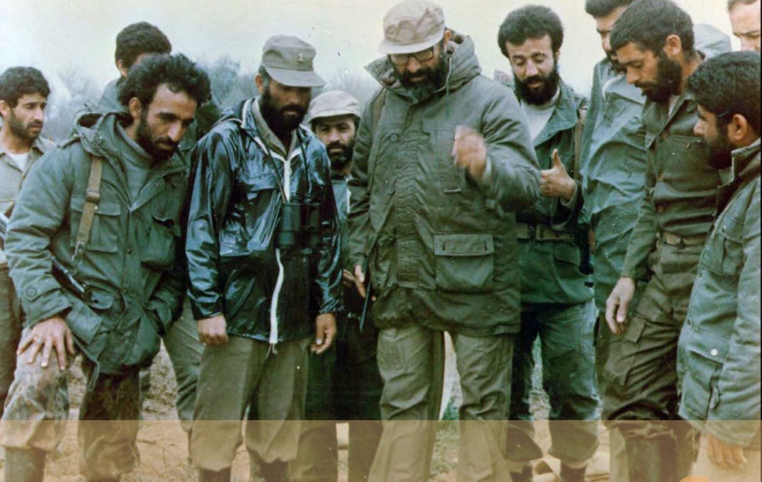
شهید چمران در جبهه