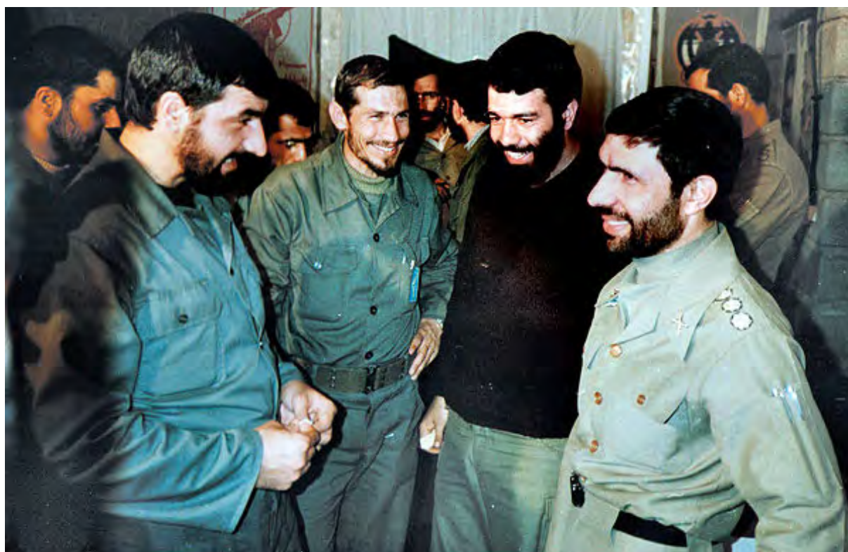
فرماندهان ارشد ارتش و سپاه در دوران دفاع مقدس (شهید صیاد شیرازی، محسن رضایی و یحیی رحیم صفوی)

در نتیجه مقاومت شجاعانه و دلاورانه نیروهای مسلح و مردم ایران، رؤیای صدام برای فتح سریع خوزستان و دیگر استان‌های مرزی ایران بر باد رفت و نیروهای متجاوز تنها موفق شدند بخش‌هایی از مناطق مرزی، از جمله شهر خرمشهر را اشغال کنند.