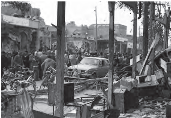
شهر مقاوم دزفول در دوران دفاع مقدس بارها هدف موشک و بمباران دشمن بعضی قرار گرفت.