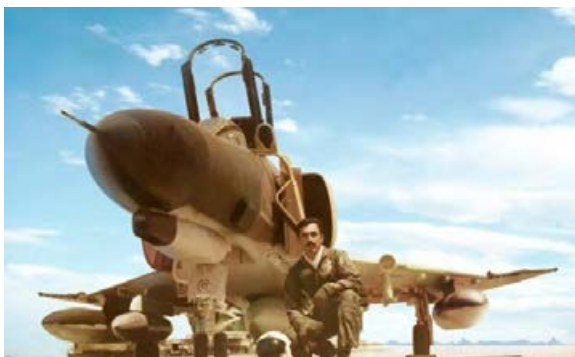
خلبان شهید خالد حیدری از نخستین شهدای نیروی هوایی در جنگ تحمیلی بود.

در طول ۸ سال جنگ تحمیلی، قدرت‌های بزرگ مانند آمریکا، شوروی، فرانسه، آلمان و انگلستان، علاوه بر دادن انواع سلاح‌های پیشرفته و حتی تسلیحات شیمیایی به رژیم بعثی عراق، به لحاظ سیاسی نیز آشکار و پنهان از این رژیم جانبداری کردند. برخی از کشورهای منطقه خلیج فارس نیز به اشکال مختلف به صدام یاری رساندند. پاره‌ای از کشورها نیز به ظاهر سیاست بی‌طرفی را در پیش گرفتند ولی در موارد متعدد از سیاست‌های تجاوزکارانه صدام حمایت می‌کردند.