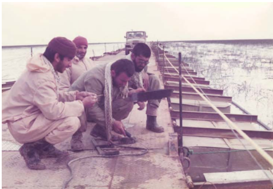
ساخت پل شناور خیبر بر روی هور العظیم یکی از شاهکارهای مهندسی رزمی جهادگران در دوران دفاع مقدس بود.

بیشترین حضور مردمی در صحنه‌های نبرد در قالب نیروهای بسیجی و جهاد سازندگی انجام گرفت. نیروهای مردمی در کنار دیگر نیروهای نظامی کمک فراوانی در پیشبرد جنگ و کسب پیروزی در نبردهای زمینی داشتند. از میان نیروهای مردمی که از همان آغاز جنگ در جبهه‌ها وارد رزم شدند سه گروه شاخص بودند: گروه جنگ‌های نامنظم شهید مصطفی چمران که در سال دوم جنگ به سپاه پاسداران پیوست؛ نیروهای بسیج که در قالب یگان‌های سپاه وارد صحنه نبرد شدند و در نهایت جهادگران جهاد سازندگی که برای انجام اقدامات متنوع مهندسی و مهندسی رزمی و ساخت مواضع و زدن خاکریز به جبهه آمدند.