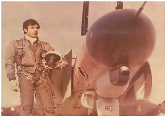
خلبانان شهید محمد صالحی از نخستین شهدای نیروی هوایی ارتش جمهوری اسلامی بود.

۴- تصمیم می‌گیرد که مجدداً و در صورت نیاز تشکیل جلسه دهد تا اتخاذ دیگر تدابیر لازم را برای اجرای این قطعنامه بررسی کند.