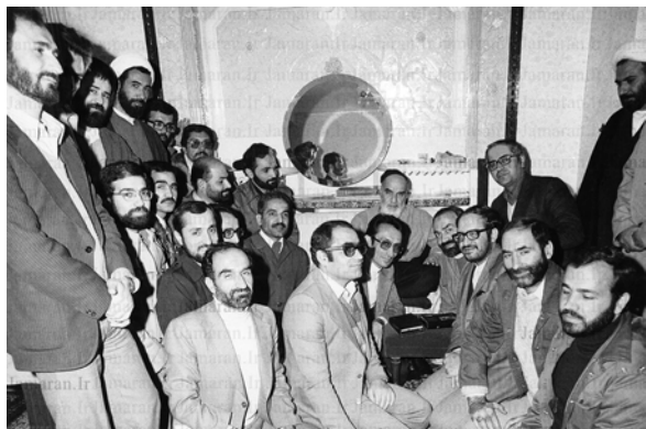
اعضای هیئت دولت شهید محمدعلی رجایی هنگام دیدار با حضرت امام (ره)

پس از شروع به کار مجلس شورای اسلامی، ابتدا نخست‌وزیر (محمدعلی رجایی) معرفی شده از سوی رئیس‌جمهور و سپس وزاری انتخاب شده توسط نخست‌وزیر از مجلس شورای اسلامی رأی اعتماد گرفتند و دولت دائم بر سر کار آمد و اداره امور کشور را از شورای انقلاب تحویل گرفت.