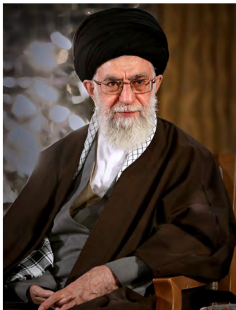
حضرت آیت‌الله خامنه‌ای (مدظله العالی)

حضرت آیت‌الله خامنه‌ای از ابتدای نهضت تا زمان پیروزی انقلاب اسلامی به عنوان شاگرد و پیرو حضرت امام خمینی (ره) حضور و نقش فعالی در مبارزه با رژیم پهلوی داشتند؛ از این رو، بارها دستگیر، زندانی و تبعید شدند. ایشان در دوران جمهوری اسلامی و در شرایطی که کشور گرفتار توطئه‌های پیچیده دشمنان خارجی و ضد انقلاب داخلی و نیز جنگ تحمیلی بود، همچون یابوری بصیر و ثابت‌قدم در خدمت انقلاب و حضرت امام بودند و مسئولیت‌های خطیری را از جمله دو دوره ریاست جمهوری عهده‌دار