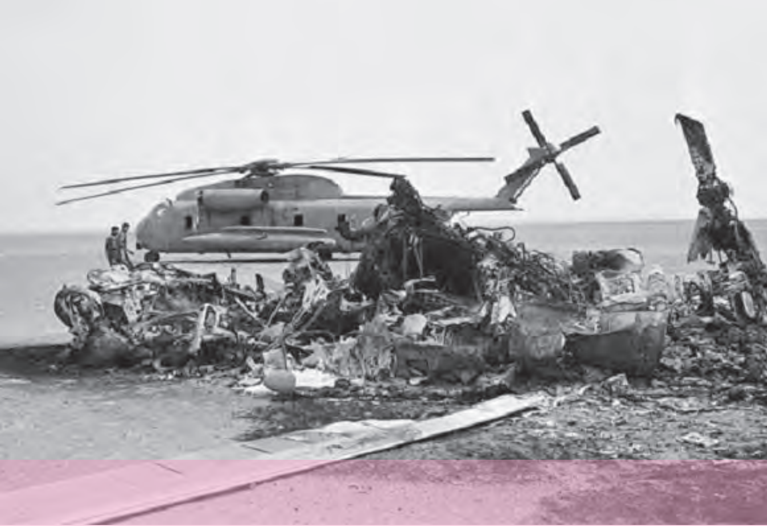
بقایای لاشه هواپیماها و بالگردهای آمریکایی در طیس