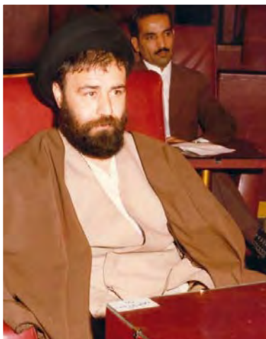
حاج سید احمد آقا خمینی

حجت‌الاسلام سید احمد خمینی در ۲۴ اسفند ۱۳۲۴ در قم به دنیا آمد. تحصیلات دوره ابتدایی و متوسطه را در زادگاهش گذرانید و از دبیرستان حکیم نظامی قم در رشته طبیعی (علوم تجربی) دیپلم گرفت. همزمان با تحصیل در دبیرستان، ورزش فوتبال را نیز با جدیت دنبال کرد. ایشان پس از اخذ دیپلم تحصیلات حوزوی را پی گرفت. جریان قیام ۱۵ خرداد ۱۳۴۲، علاقه‌اش به سیاست و عزمش را به مبارزه با حکومت پهلوی بیش از گذشته آشکار ساخت. حاج سید احمد آقا از سال ۱۳۴۳ش و به دنبال دستگیری و تبعید رهبر نهضت اسلامی (امام خمینی) و برادر بزرگش (حاج آقا مصطفی خمینی) به ترکیه و سپس عراق، مسئولیت‌های سنگینی را در خانواده حضرت امام و نیز در عرصه مبارزه با حکومت ستم‌شاهی بر عهده گرفت. به همین دلیل ساواک فعالیت‌های او را زیر نظر گرفته بود. با این حال، با تیزی و درایت دستورات امام را انجام می‌داد.