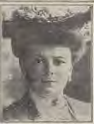
THE DUCHESS OF HOHENBERG