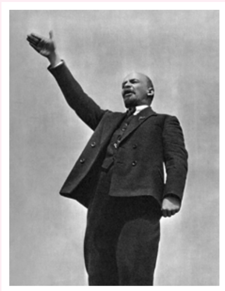
لنین رهبر انقلاب نوامبر ۱۹۱۷ روسیه

اوضاع و شرایط نابسامان دوران جنگ جهانی اول مردم روسیه را که از سال‌ها قبل نسبت به حکومت خود کاملاً تزارها ناخشنود بودند، خشمگین کرد. از این رو عده‌ای از مخالفان به کمک واحدهایی از ارتش در پتروگراد (پایتخت) دست به شورش زدند و با تشکیل دولت موقت، نیکولای دوم آخرین تزار روس را برکنار کردند. در این اثنا، گروهی از انقلابیون سوسیالیست روسی معروف به بلشویک‌ها به رهبری لنین که در تبعید به سر می‌بردند، با حمایت آلمانی‌ها به روسیه بازگشتند.