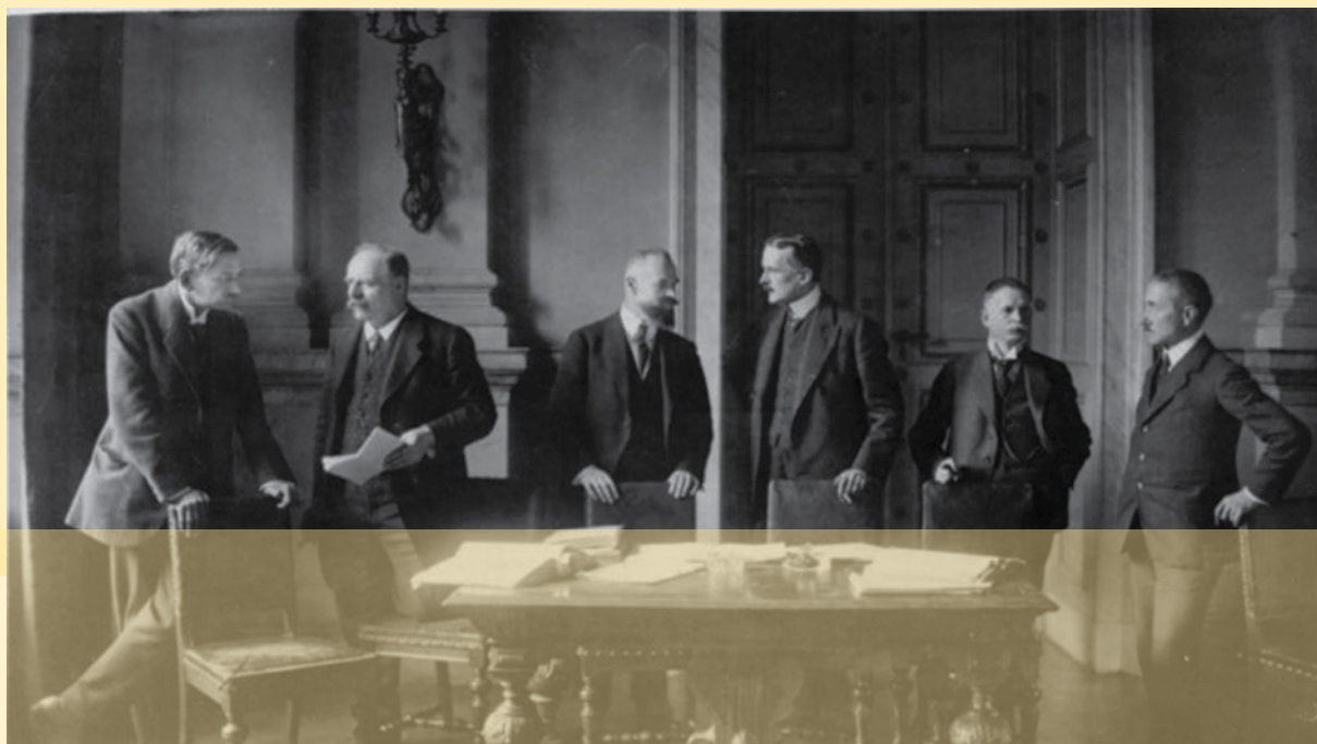
سران کشورهای پیروز در کنفرانس صلح ورسای

این پیمان، مستعمرات آلمان میان متفقین تقسیم و بخش‌هایی توان نظامی خود را محدود نگه دارند. از خاک این کشور به فرانسه و لهستان واگذار گردید. علاوه بر آن، آلمان‌ها ملزم شدند به دولت‌های متفق غرامت بپردازند و