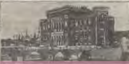
THE ROYAL PALACE IN SARAJEVO