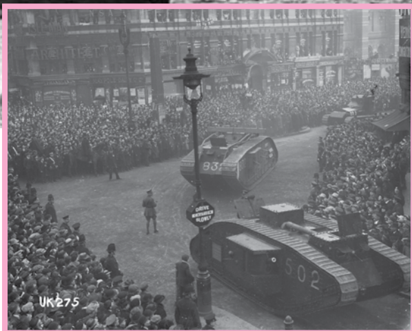
رژهٔ تانک‌ها در خیابان‌های لندن پس از جنگ جهانی اول