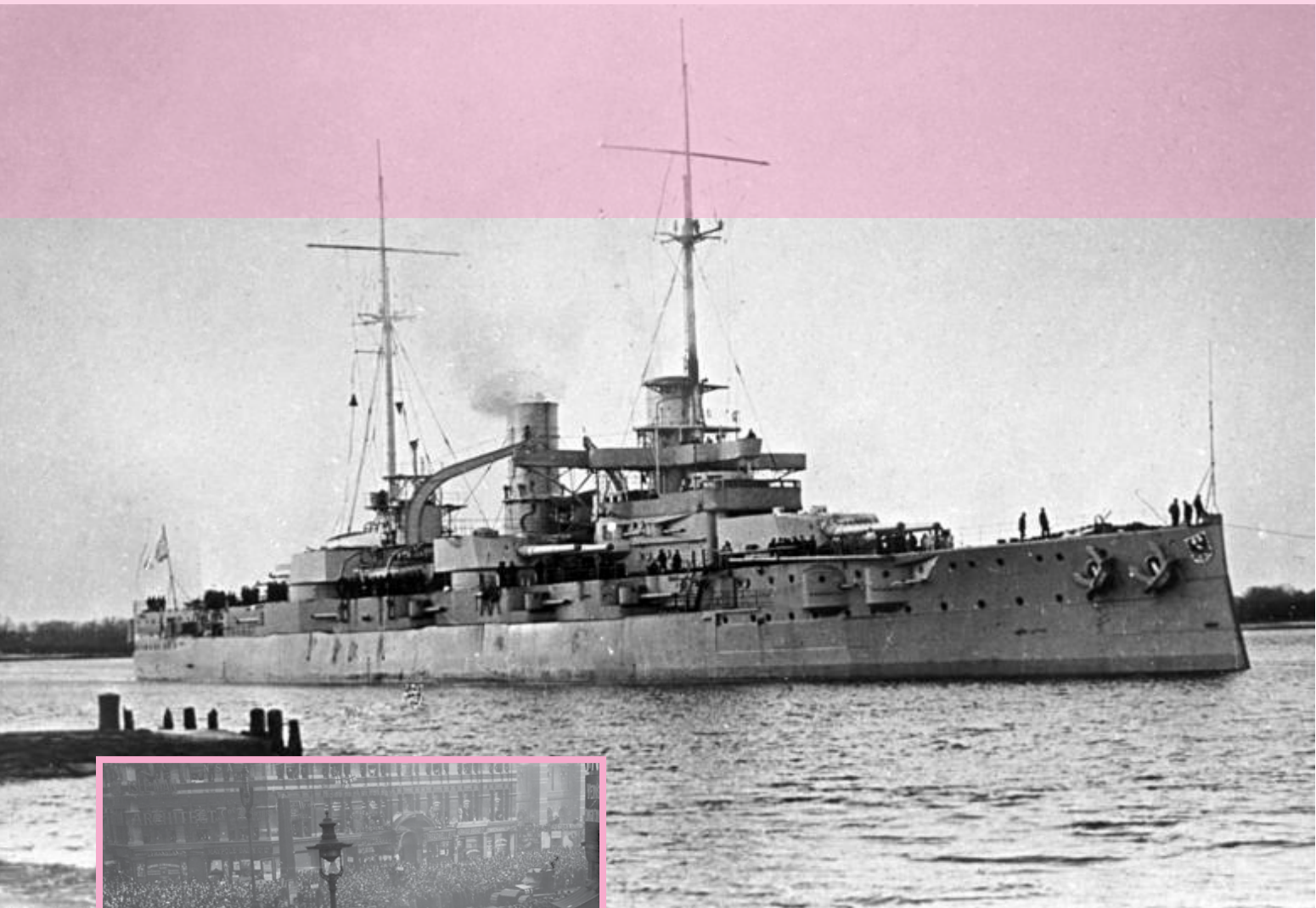
ناوگان جنگی آلمان در جنگ جهانی اول

با وجود اینکه طرف‌های جنگ امیدوار بودند خیلی زود به پیروزی برسند، اما جنگ به مدت ۴ سال در زمین، دریا و حتی هوا ادامه یافت. در جبهه شرقی روس‌ها به سرعت بسیج شدند و مانع سقوط و اشغال کشورشان توسط ارتش آلمان شدند. در جبهه غربی نیز فرانسوی‌ها با حمایت انگلیسی‌ها و سایر دولت‌های متفق مقاومت کردند و جنگ را به حالت فرسایشی در آوردند. در خاورمیانه و برخی از مستعمرات نیز شعله‌های جنگ برافروخته شد.