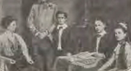
THE ARCHDUKE AND HIS FAMILY