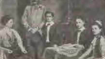
THE DUCHESS OF HOHENBERG AND HER FAMILY