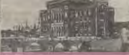
THE ROYAL PALACE IN SARAJEVO