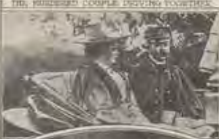
THE ASSASSINATED COUPLE DRIVING TOGETHER