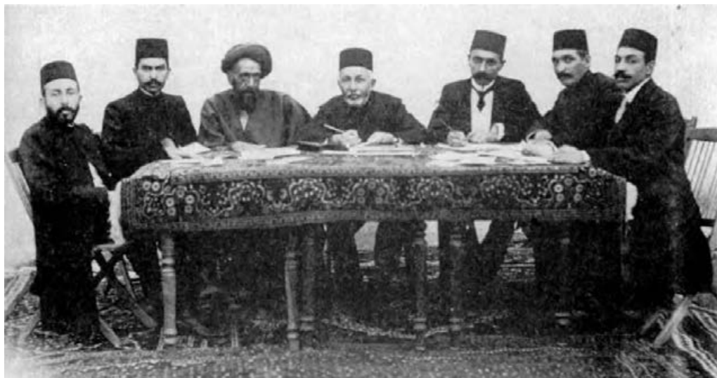
تعدادی از اعضای دولت موقت ملی در کرمانشاه

نظامیان روسی بخش وسیعی از نیمه شمالی کشورمان را که بر اساس معاهده ۱۹۰۷ به عنوان منطقه تحت نفوذ روسیه شناخته شده بود، اشغال کردند. انگلستان نیز گروهی از افسران انگلیسی و مزدوران هندی را به ایران فرستاد و نیروی پلیس جنوب را در بخش‌های جنوبی میهن ما تشکیل داد. این دو دولت اشغالگر سپس طی قرارداد ۱۹۱۵ ایران را به دو قسمت تقسیم کردند؛ نیمه شمالی متعلق به روسیه و نیمه جنوبی سهم انگلستان شد. با