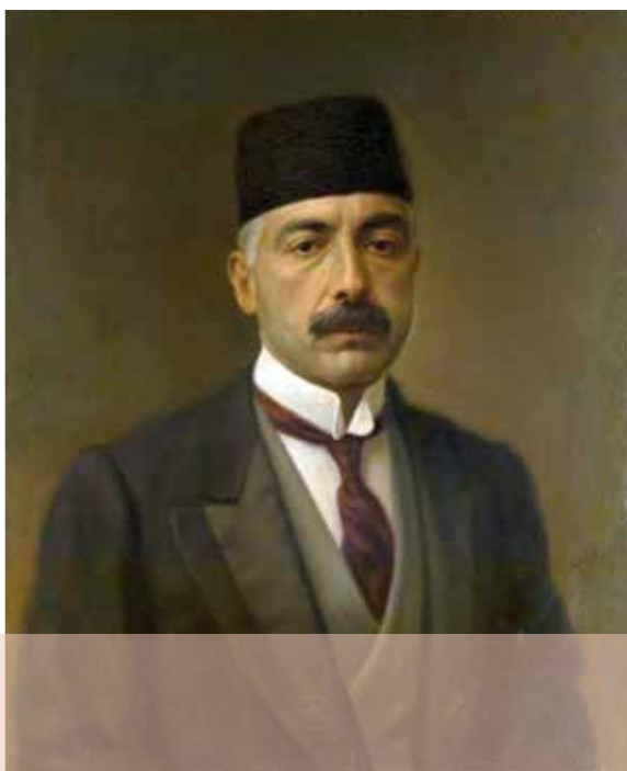
حسن و ثوق الدوله

به دنبال پیروزی انقلاب روسیه (نوامبر ۱۹۱۷ م/پاییز ۱۲۹۶ ش)، دولت بلشویکی این کشور نیروهای خود را از ایران فراخواند. انگلستان با تقویت واحدهای نظامی خود، علاوه بر نواحی جنوبی، مناطقی از نیمه شمالی ایران را نیز اشغال کرد. در آن زمان حکومت ایران در نهایت ضعف و انحطاط سیاسی و اقتصادی به سر می‌برد. دولت مرکزی توان اعمال حاکمیت در بسیاری از مناطق کشور را نداشت. برخی از سران ایلات و حاکمان محلی نافرمانی می‌کردند و شورش‌هایی در گوشه و کنار مملکت در حال شکل‌گیری بود. از نظر اقتصادی نیز دولت در تنگناهای شدید قرار داشت و برای تأمین بخش عمده‌ای از مخارج روزمره خود نیازمند دریافت پول از انگلستان بود. در چنین شرایطی و در حالی که روس‌ها سرگرم جنگ داخلی بودند، انگلیسی‌ها فرصت را برای تحکیم نفوذ و سلطه پایدار و تأمین منافع درازمدت خود در ایران مغتنم شمردند و قرارداد ۱۹۱۹ را با دولت و ثوق الدوله (۱۲۹۷-۱۲۹۹ ش) منعقد کردند.