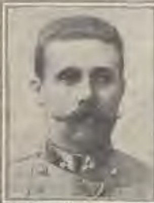
ARCHDUKE FRANCIS FERDINAND

The explosion in the city of Sarajevo, Bosnia, was a tragedy. It was a tragedy.