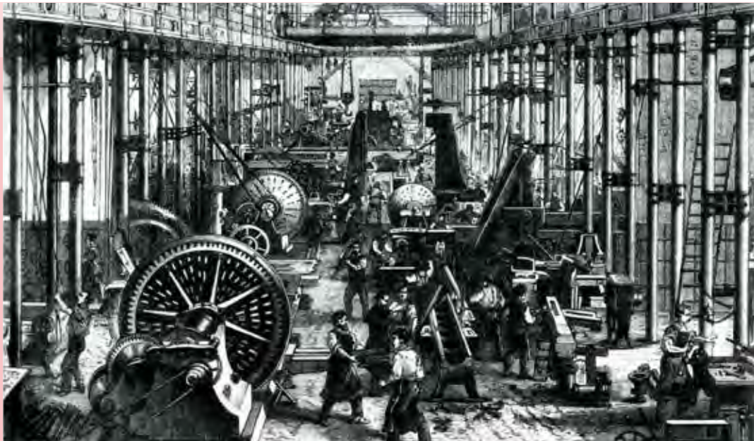
یکی از کارخانه‌های صنعتی بزرگ آلمان در ۱۸۶۸م