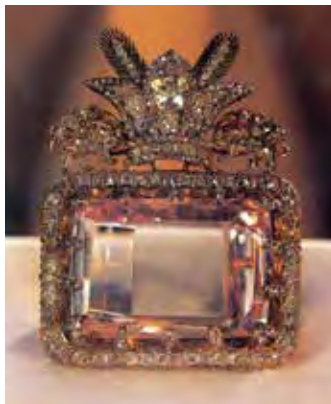
الماس دریای نور