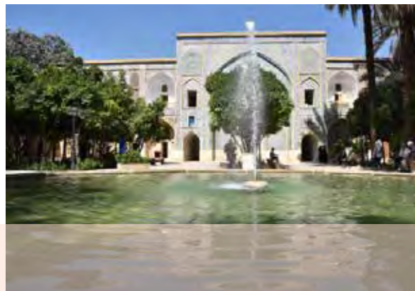
مدرسه آقاباباخان شیراز؛ ساخت این مدرسه به دستور کریم‌خان زند شروع شد و پس از او تکمیل شد.