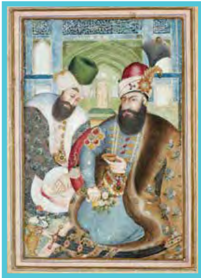
نگاره کریم خان زند هنگام دیدار با فرستاده عثمانی

خود به ویژه فارس را پس از سال‌ها جنگ و ناامنی فراهم آورد. کریم‌خان برخلاف سنت معمول از پذیرفتن عنوان شاه امتناع کرد و خود را وکیل مردم ایران (وکیل‌الرعا یا) خواند. پاره‌ای از خصوصیات اخلاقی و سلوک او مانند مدارا با دشمنان، همدردی با مردم، ساده‌زیستی و رفتار مناسب با اقلیت‌های دینی و مذهبی، نام و نشان نیکی از او در تاریخ ایران به جای گذاشته است.