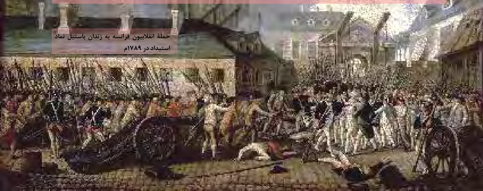
حملهٔ انقلابیون فرانسه به زندان باستیل نماد استبداد در ۱۷۸۹م

سرانجام در ۱۴ ژوئیه ۱۷۸۹ مردم غالباً بی‌نوا و خشمگین پاریس با حمله به زندان باستیل انقلاب خویش را آغاز کردند. انقلابیون سرانجام لویی شانزدهم پادشاه مستبد فرانسه را وادار به امضای قانون اساسی جدید و پذیرش نظام مشروطهٔ سلطنتی کردند. مدتی بعد انقلابیون تندرو پادشاه را عزل و نظام جمهوری را برقرار کردند. آنان سپس لویی و همسرش ماری آنتوانت را اعدام کردند. اعدام این دو و افکار و شعارهای آزادی خواهانهٔ انقلاب موجب ترس و خشم کشورهای اروپایی