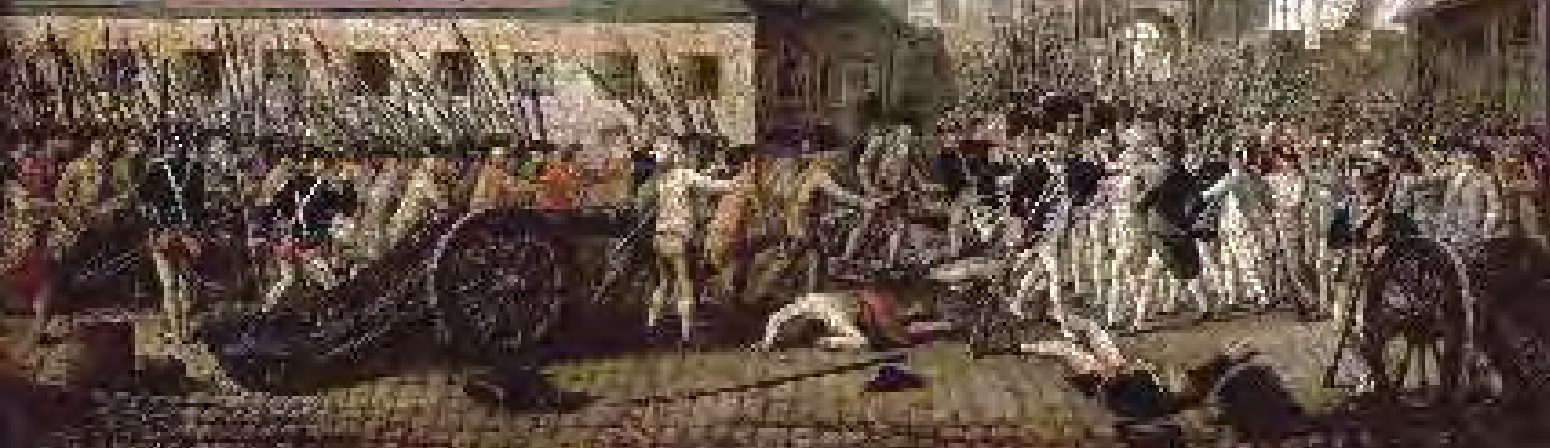
حملهٔ انقلابیون فرانسه به زندان باستیل نماد استبداد در ۱۷۸۹م

سرانجام در ۱۴ ژوئیه ۱۷۸۹ مردم غالباً بی‌نوا و خشمگین پاریس با حمله به زندان باستیل انقلاب خویش را آغاز کردند. انقلابیون سرانجام لویی شانزدهم پادشاه مستبد فرانسه را وادار به امضای قانون اساسی جدید و پذیرش نظام مشروطهٔ سلطنتی کردند. مدتی بعد انقلابیون تندرو پادشاه را عزل و نظام جمهوری را برقرار کردند. آنان سپس لویی و همسرش ماری آنتوانت را اعدام کردند. اعدام این دو و افکار و شعارهای آزادی خواهانهٔ انقلاب موجب ترس و خشم کشورهای اروپایی