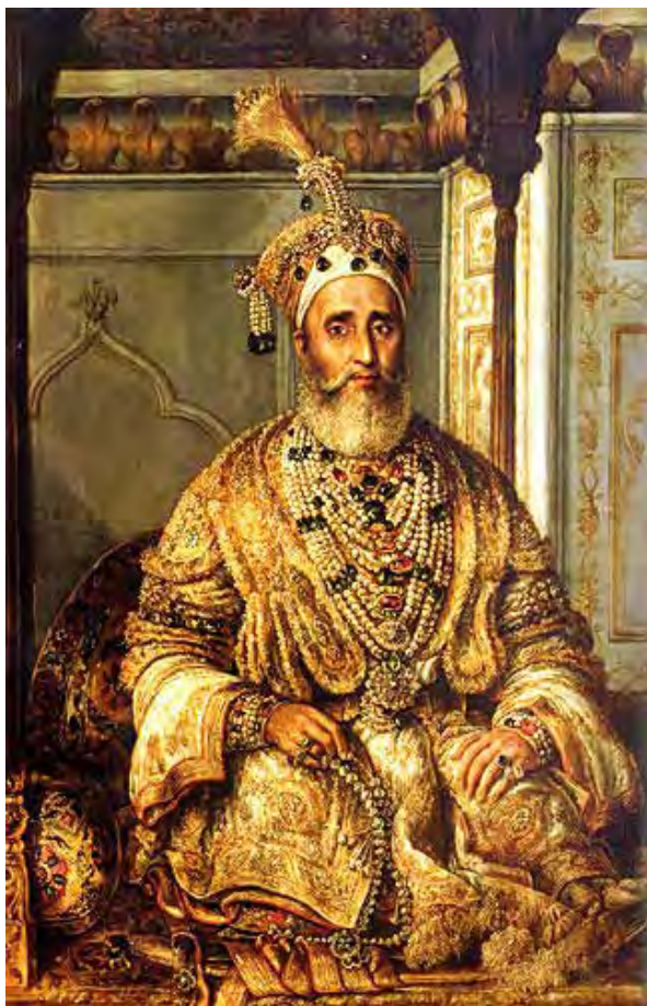
بهادر شاه دوم، آخرین فرمانروای گورکانی هند (۱۸۳۷-۱۸۵۷م) که توسط کمپانی هند شرقی انگلستان از قدرت برکنار و به برمه تبعید شد.

کمپانی هند شرقی فعالیت‌های استعماری خود را گسترش دادند. استعمارگران اروپایی به تدریج با دامن زدن به اختلافات دینی و قومی در هند، بخش‌هایی از سرزمین هند را تصرف کردند. در همان حال چون میان استعمارگران رقابت شدیدی وجود داشت و جنگ‌هایی میان آنان در گرفت که با پیروزی انگلستان به پایان رسید. انگلیسی‌ها با غارت وسیع سرزمین ثروتمند هند توانستند پایه‌های قدرت خود در جهان را توسعه داده و برای حفظ سلطه خویش به دخالت و دست‌اندازی به کشورهای همسایه هند از جمله ایران پرداختند. سرانجام در سال ۱۸۵۷م. پس از سرکوب شورش سربازان هندی دولت انگلستان رسماً هند را جزئی از قلمرو خویش اعلام نموده و ملکه انگلستان به امپراتریس هند و بریتانیا ملقب گردید.