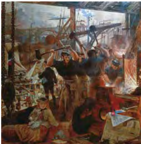
تابلوی آهن و زغال سنگ اثر نقاش اسکاتلندی ویلیام بل اسکات در اواسط سده ۱۹م