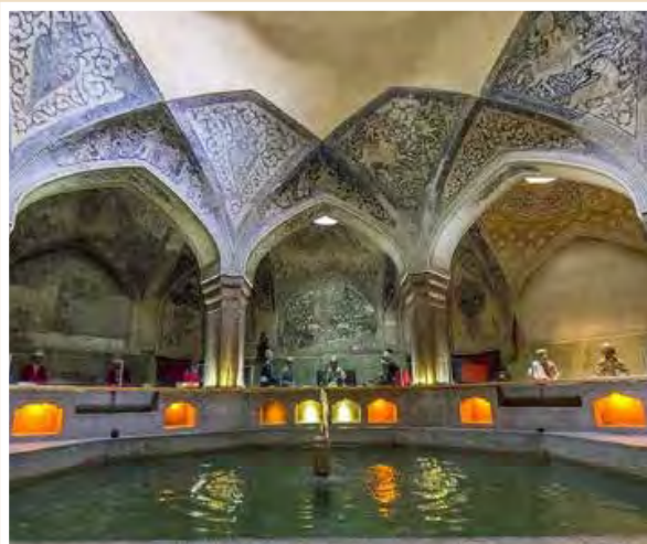
حمام وکیل - شیراز

سلطان سلیم سوم (۱۸۰۷-۱۷۸۹م) هنگام به حضور پذیرفتن مقام های امپراتوری در کاخ توپ کاپی - استانبول