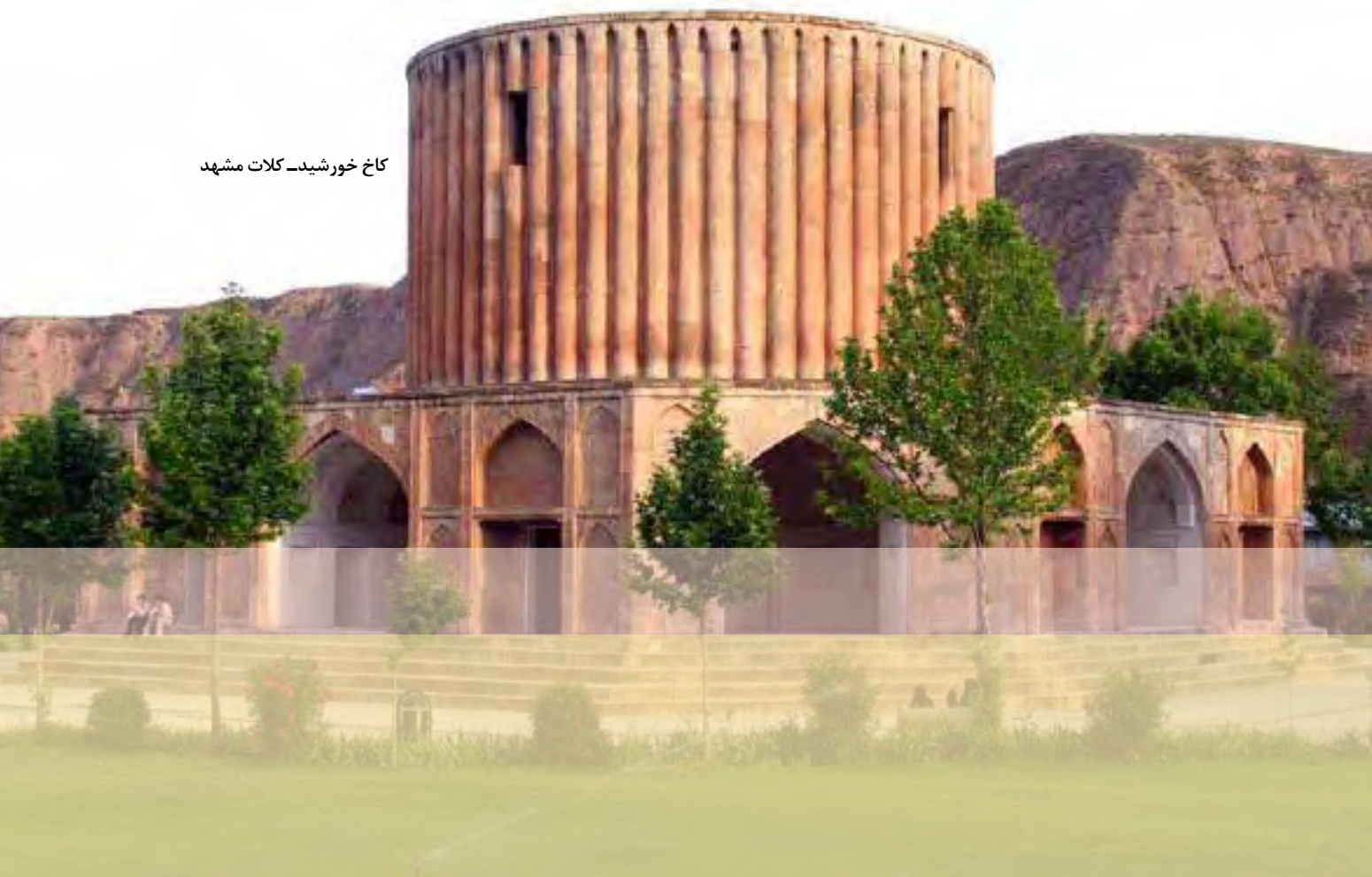
کاخ خورشید- کلات مشهد

به دلیل آشفتگی سیاسی و اجتماعی کشور پس از صفویان امکان رشد و ترقی هنر و معماری دور از انتظار بود. با این حال در زمان حکومت نادر شاه و دوره استقرار کریم‌خان زند در شیراز اقدامات قابل توجهی صورت گرفت. ورود هنرمندان و صنعتگران هندی پس از فتوحات نادر در هند موجب تلفیق هنر ایرانی و هندی شد. مدارا و احترام کریم‌خان نسبت به هنرمندان و علما نیز موجب رونق هنر و معماری در زمان او شد. در دوران نادر شهر اصفهان بازسازی شد و در منطقه کلات که محل نگهداری خزاین نادر بود بناهای باشکوهی مانند کاخ خورشید ساخته شد.