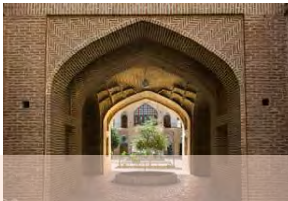
مدرسه علمیّه خان یزد؛ این مدرسه توسط محمدتقی خان والی خیراندیش یزد در سال ۱۱۸۶ق بنا شد.

شعر و ادب فارسی در این دوره تحول چشمگیری یافت که محققان از آن به نهضت بازگشت ادبی یا سبک اصفهانی یاد نموده‌اند. چهره‌های برجسته این سبک ادبی، در برابر سبک هندی که در دوره صفویه به وجود آمده بود به سرانگشتن شعر به سبک خراسانی و شعرایی هم چون فرخی، عنصری، سعدی و حافظ پرداختند.