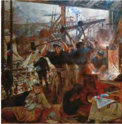
تابلوی آهن و زغال سنگ اثر نقاش اسکاتلندی ویلیام بل اسکات در اواسط سده ۱۹م