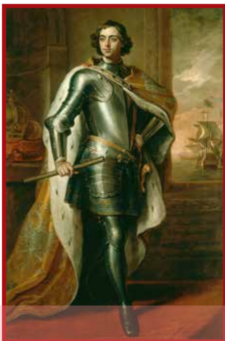
پتر کبیر پدر روسیه جدید

۵- روسیه در مسیر توسعه طلبی نظامی؛ روسیه در قرن ۱۷م کشوری عقب مانده و منزوی بود، اما پتر کبیر (۱۷۲۵-۱۶۸۲م) این کشور را متحول کرد و در مسیر پیشرفت و توسعه طلبی سیاسی و نظامی قرار داد. او با استخدام کارشناسان اروپایی و تأسیس مدارس و دانشگاه‌های جدید و تقویت ارتش و نیروی دریایی این کشور را به قدرت بزرگی تبدیل کرد. یکی از برنامه‌های پتر برای قدرتمند شدن روسیه گسترش سرزمین روسیه و دستیابی به دریاهای آزاد برای کسب منافع تجاری و سیاسی بود. به همین دلیل جانشینان او تلاش کردند تا به این برنامه عمل کنند و به همین سبب روس‌ها در نواحی شرقی اروپا، حوزه دریاهای بالتیک، سیاه و خزر اقدامات نظامی وسیعی انجام دادند. این اقدامات موجب جنگ‌های متعدد روسیه با ایران، عثمانی و برخی کشورهای اروپایی نظیر فرانسه شد.